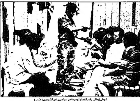
خريطة إيطالية يقسم الغد لاجرة مع المهاجرين الذين يهربون (أف)